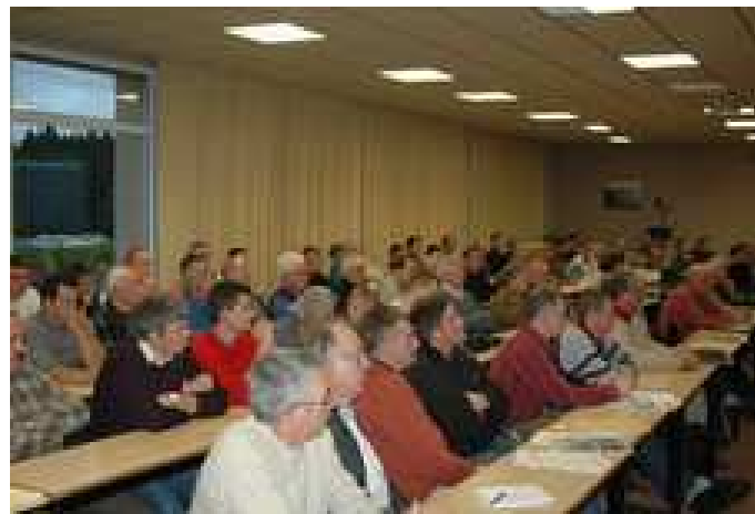
Vue de l'assemblée