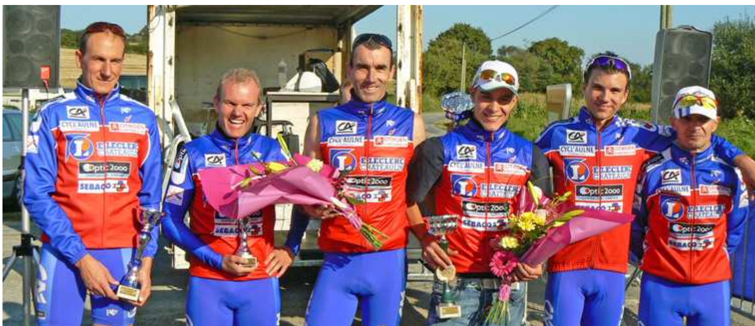
Le podium du temps réel