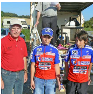
Le duo le plus jeune