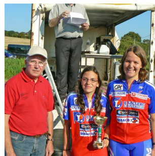
le duo Dames