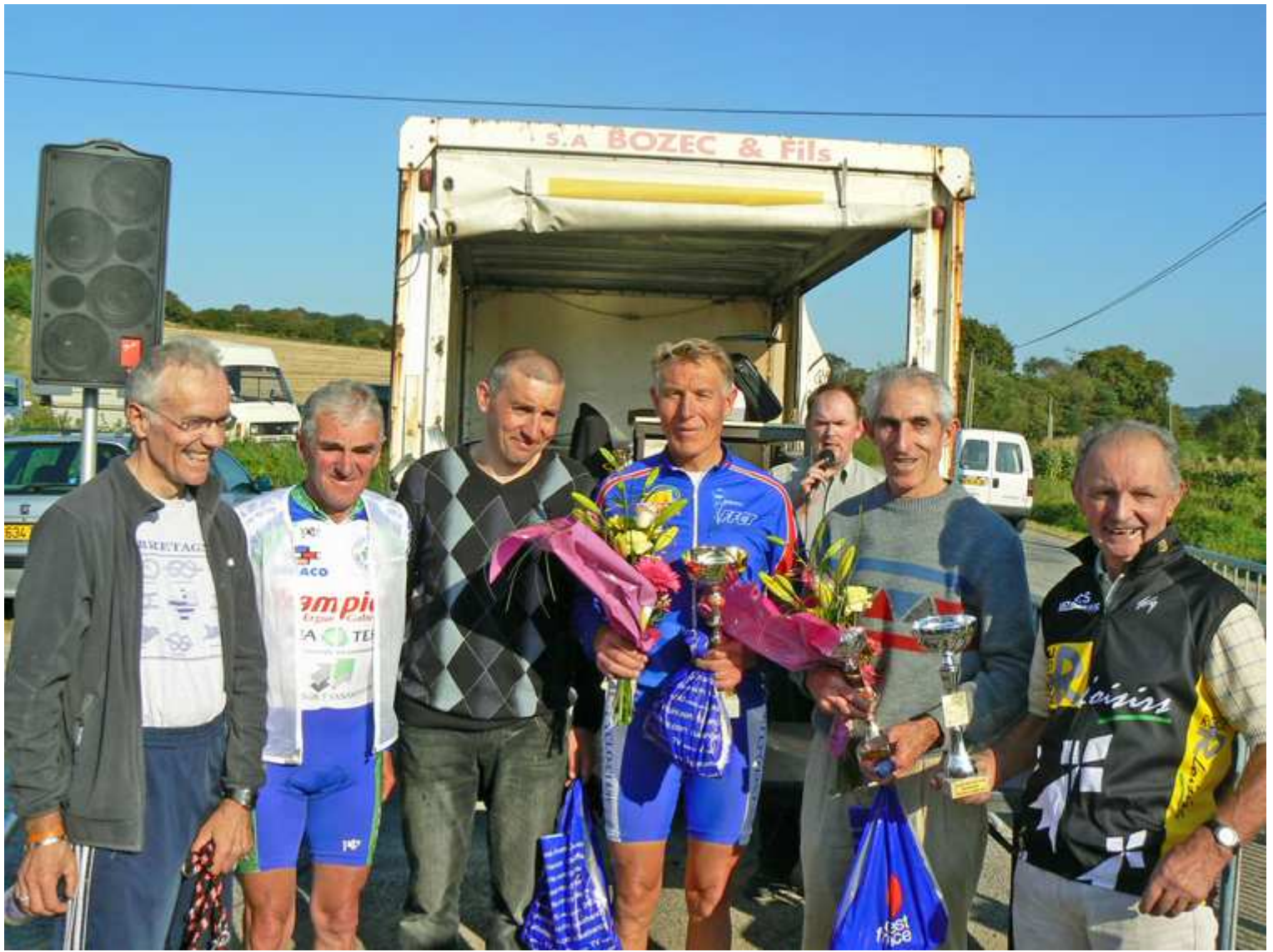
Le podium en temps compensé