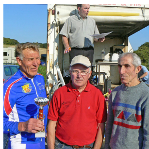
le duo le plus agé