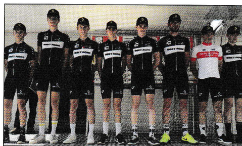
La sélection bretonne au départ.