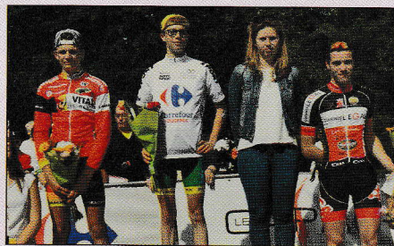
Le podium des cadets.