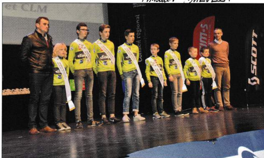
L'École de cyclisme de l'OC Locminé vainqueur du Trophée Régional.