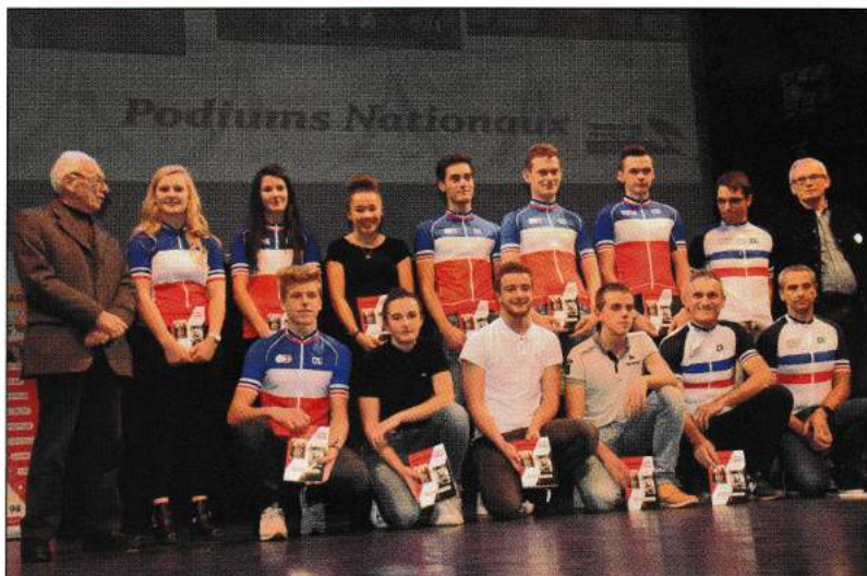
Les champions de France piste.