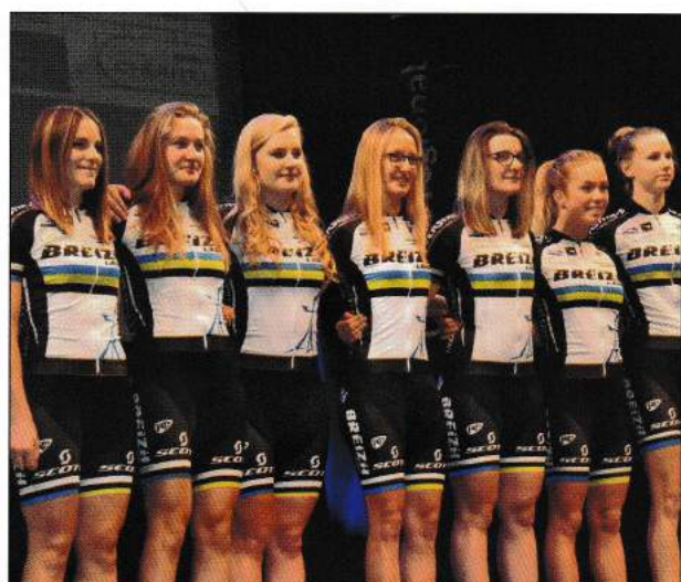
La DN Dames 2018.