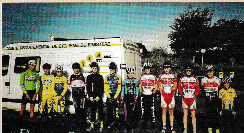
Le soleil était au rendez-vous du premier rassemblement cyclo-cross de la saison.