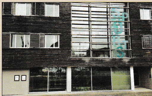
Le comité départemental du Finistère a un nouveau siège. Voici la nouvelle adresse : Maison Départementale des Sports 4 rue Anne Robert Jacques Turgot 29000 Quimper.