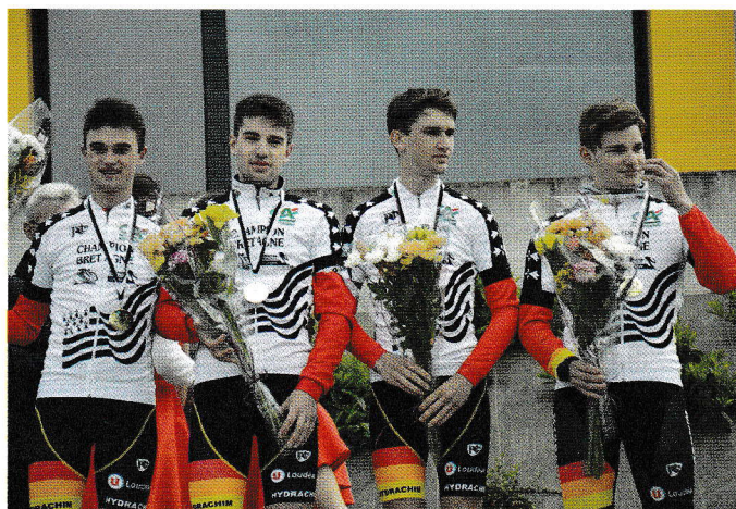
Les juniors du VC Pays de Loudéac.