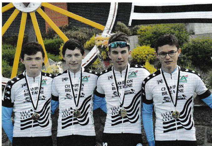
Les cadets de l'AC Léonarde.