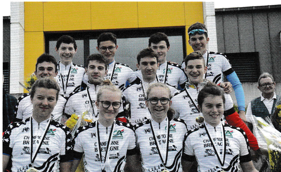
La joie des vainqueurs des épreuves cadettes, cadets et juniors hommes.