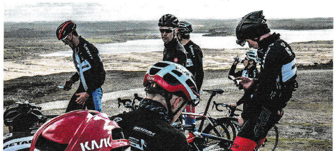
Les coureurs ont notamment parcourus les routes des Monts d'Arrée.