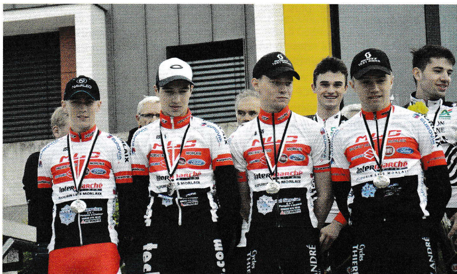
Les juniors de l'UCP Morlaix se classent 2°.

Cadettes. 1. Comité 29 les 14,5 km en 25'37", 2. Comité 35 (1) à 36", 3. AC Lanester 56 à 58", 4. Comité 22, 5. EC Quéven, 6. Comité 35 (2).