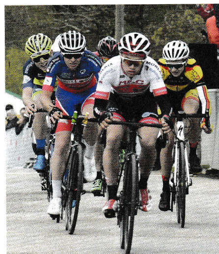
La bonne échappée file vers la ligne.