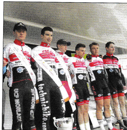
! Le joli collectif de l'UC Pays de Morlaix a été primé.