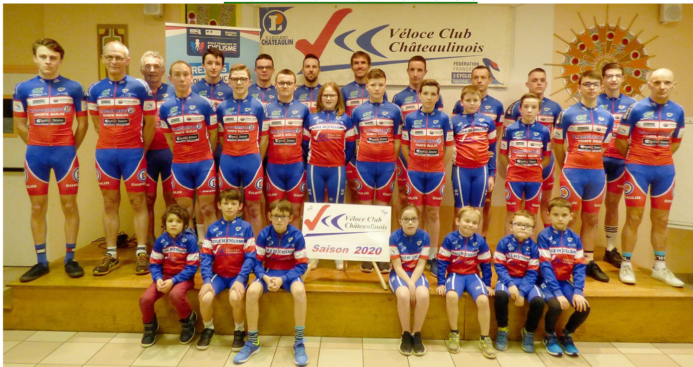
Samedi 15 février s'est déroulée au Juvénat la traditionnelle cérémonie de présentation des effectifs. A cette date, le club compte 72 licenciés (voir détail colonne à droite)